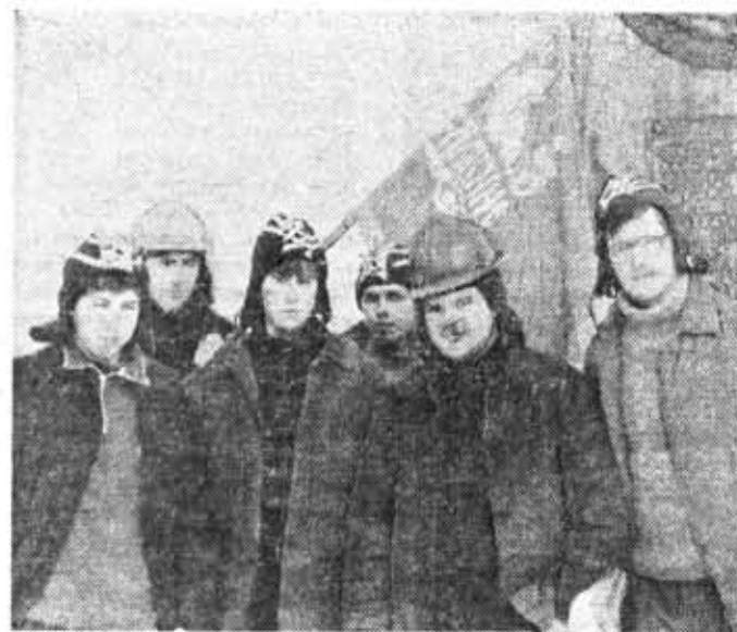
Бойцы студенческого строительного отряда «Славяне» у памятника погибшим воинам в деревне Гостилицы Ломоносовского района.