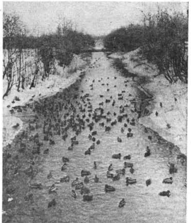
Птичий базар в Купчине.

Бросил солище в сосновые лапы И в росинках зажег огоньки, Светлым дождиком звонко прокапал И ольхою зацвел у реки. В лес и в поле принес он тревогу, Слово сказочный, песенный Лель... По тропинкам лесным, по дорогам Прошагал снеглазый апрель. Валентина СЕРКОВА, студентка