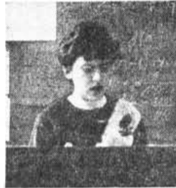
На ежегодной студенческой научно-технической конференции особенно продуктивно прошли заседания секции конструирования и производства оптических приборов.