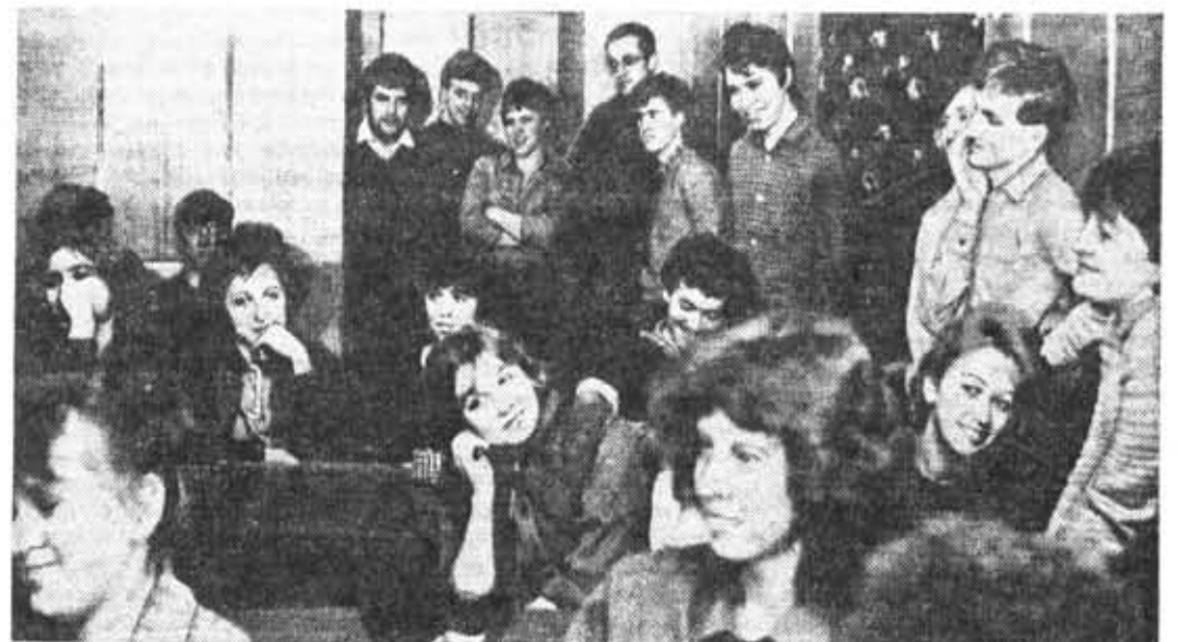
В студенческом городке на Вяземском большую аудиторию неизменно собирают «Клуб молодежи» и лекторий «Право и молодежь». Материалы о их работе читайте на четвертой странице. На снимке: заседание клуба.

Обсуждение проекта ЦК КПСС будет проходить и в нашем институте. Газета «Кадры приборостроению» предоставит возможность всем своим читателям высказаться по вопросам перестройки высшего образования, внести конкретные предложения по поводу совершенствования учебного процесса и научной деятельности в нашем институте. Хотелось бы, чтобы в этом обсуждении приняли участие и студенты. Ведь в проекте ЦК КПСС затронут широкий круг проблем образования и воспитания молодежи, подготовки ее к будущей самостоятельной трудовой деятельности.