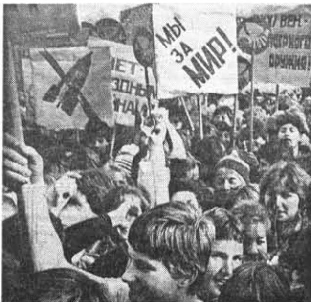
На манифестации ленинградской молодежи за прекращение ядерных испытаний, за запрещение оружия массового уничтожения.

поргов. Состоявшаяся в октябре отчетно-выборная комсомольская конференция факультета подвела итоги борьбы за знания. Абсолютная успеваемость по итогам зимней сессии составляла 90,4 процента — второе место по институту. Число задолжников при этом было 148 человек. По итогам весенней сессии факультет вышел на первое место по институту: абсолютная успеваемость составила 91,7 процента, число задолжников сократилось до 43 человек. Тревожное положение складывается на первом и втором курсах, а наилучших результатов добились пятикурсники, где уровень успеваемости был 94,5 процента. Значительную работу с задолжниками проводят кафедральные [Окончание на 3-й стр.]