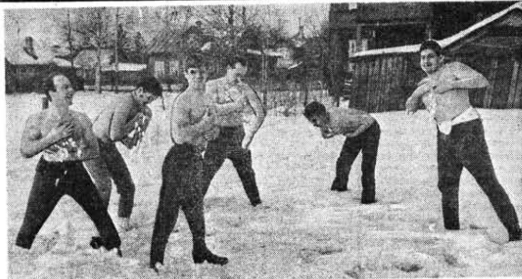
Снежные процедуры в спортивно-оздоровительном лагере.