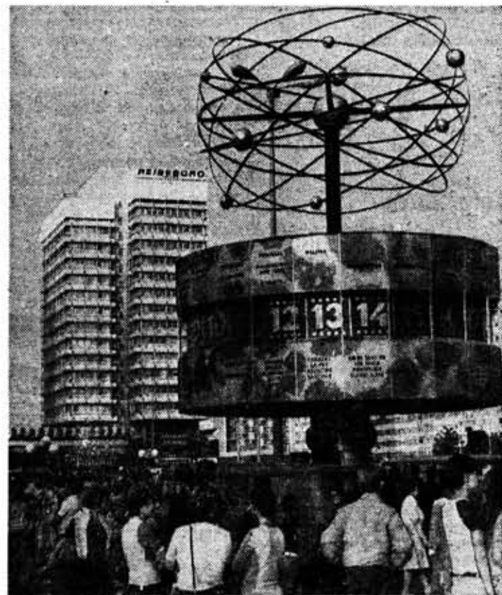
По маршрутам студенческих стройотрядов. ИССО «Товарищ» — в столице Германской Демократической Республики Берлине. Одна из достопримечательностей города — часы, показывающие время во всех часовых поясах планеты.