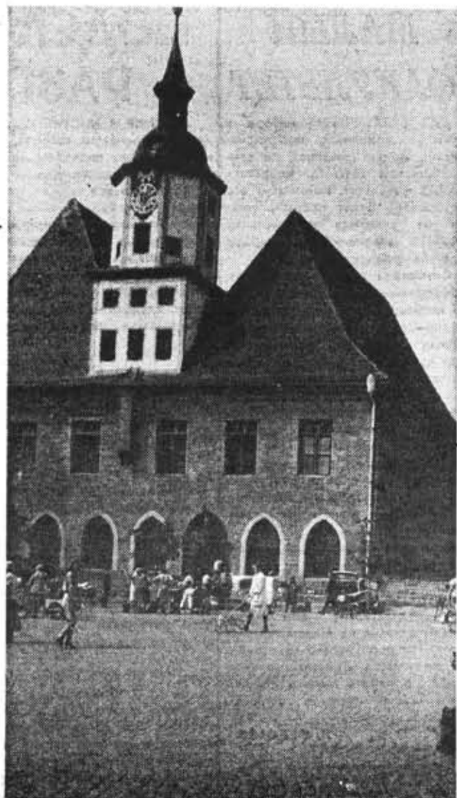
По маршрутам путешествий интеротряда. Ратуша в городе Йене.

Первые восторженные впечатления от перекрытый железнодорожного вокзала, от грандиозного мемориала Битвы народов. С высоты около ста метров открывается панорама города, его старых кварталов, богатых архитек-