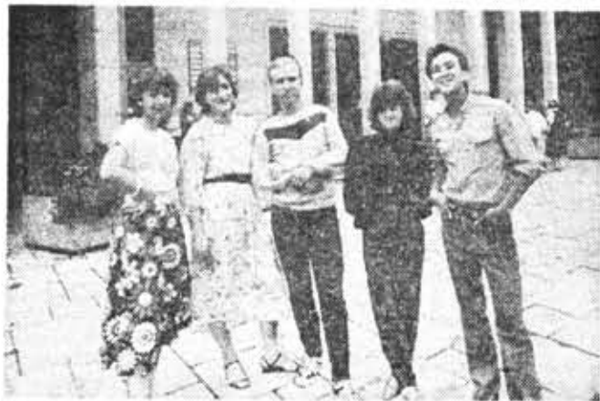
Советские студенты возле оптического музея фирмы «Карл Цейсс».