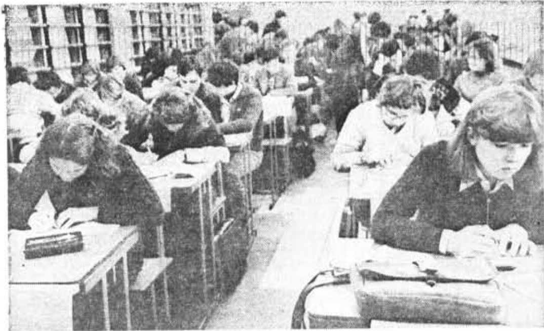
«Час пик» в читальном зале институтской библиотеки.