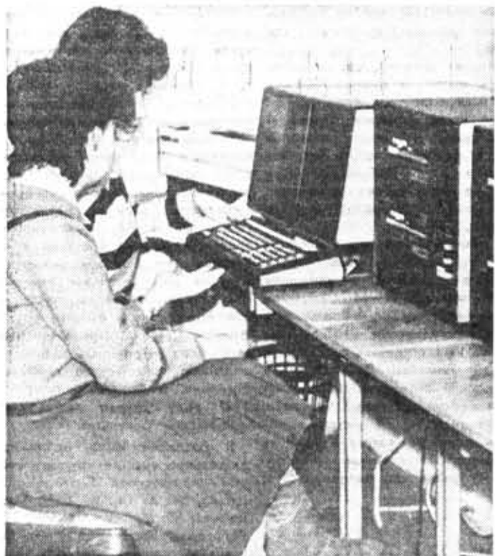
Практические занятия в вычислительном классе кафедры ВТ.