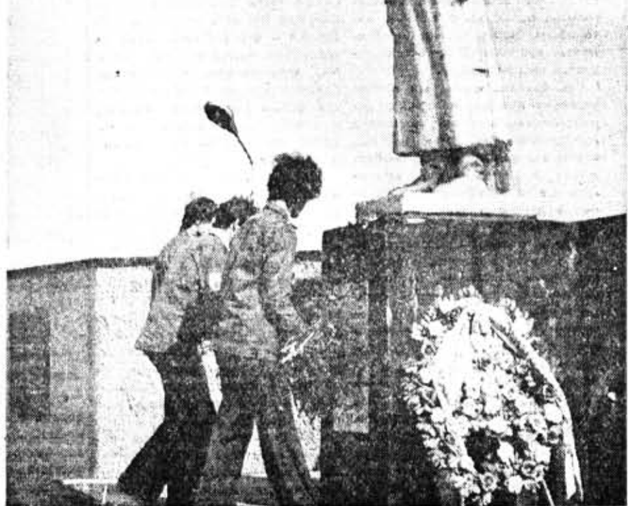
Студенты ЛИТМО, трудившиеся в третьем семестре в составе зонального стройотряда «Гатчинский», свято чтят память героев Великой Отечественной. На снимке: возложение венка к подножию монумента советскому солдату в поселке Войсковцы Гатчинского района.

В. МОТОВ, заместитель председателя совета ветеранов блокады