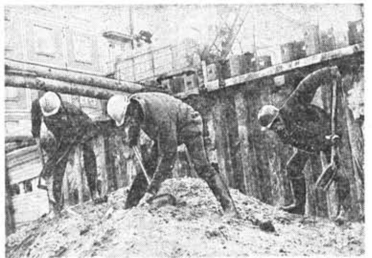
Ударная работа на субботнике.

К. ВЛАДИМИРОВ, кандидат медицинских наук