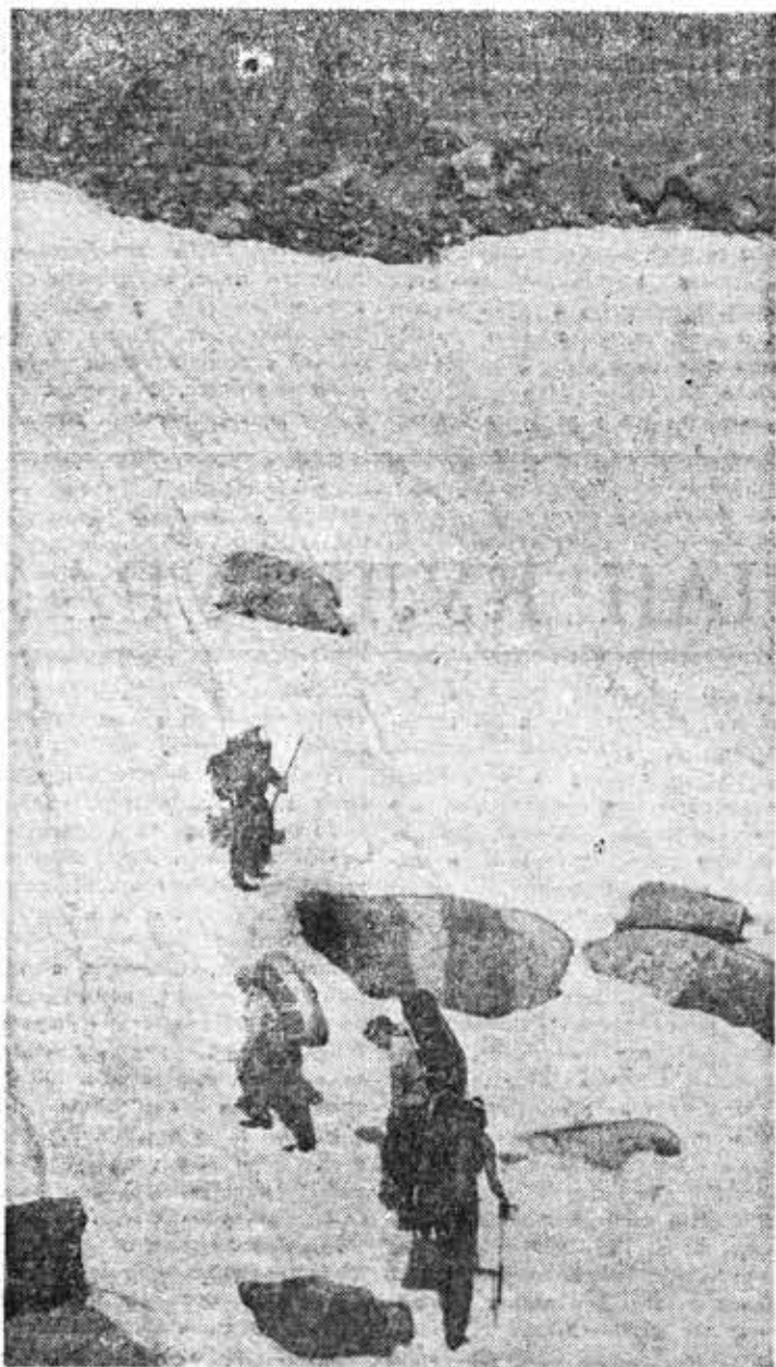
Э. Шекольян, Н. Карабанова, Д. Кравчук и Н. Полюшкина штурмуют перевал Джалама.