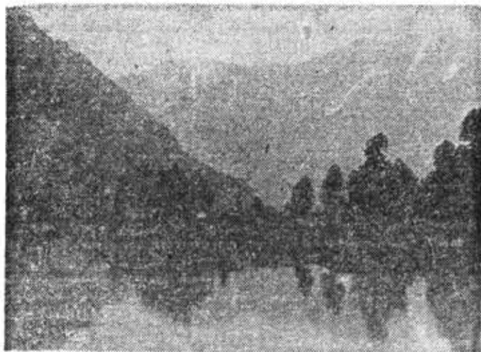
В зимнем турпоходе.