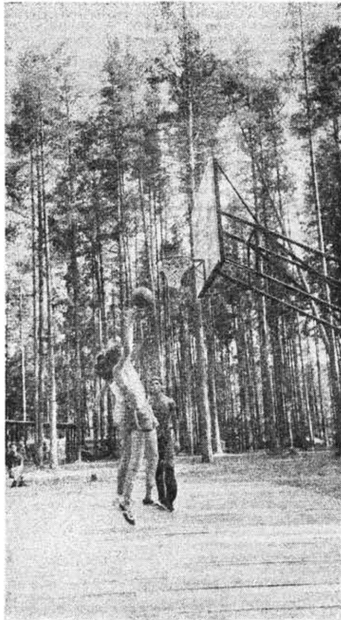
В спортивно-оздоровительном лагере ЛИТМО в Ягодном.