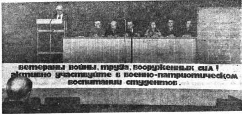
ветераны войны, труда, вооруженных сил! активно участвуйте в военно-патриотическом воспитании студентов.

На институтском военно-патриотическом вечере.