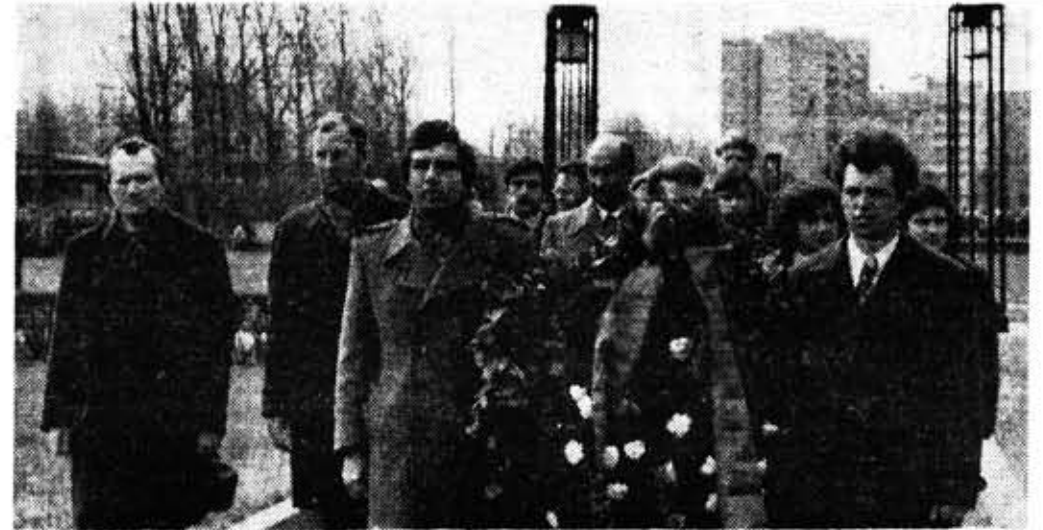
Нинто не забыт и ничто не забыто. Делегация института возлагает венок на братскую могилу защитников Ленинграда на Серафимовском кладбище.