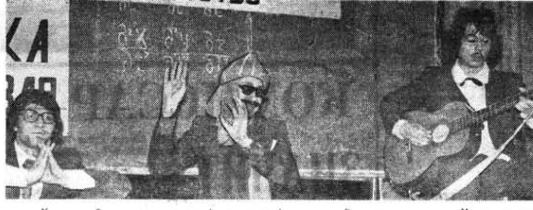
Конкурсный вечер инженерно-физического факультега. Сцена из спектакля «Математичская сказка с современным содержанием».

В спектакле были проблемы, волнующие сейчас каж- цетворял собой общий скляд орудого молодого человека планеты, жия в мире. А целью было международной безопасности. Не- нулю. ред зрителями была разыграна