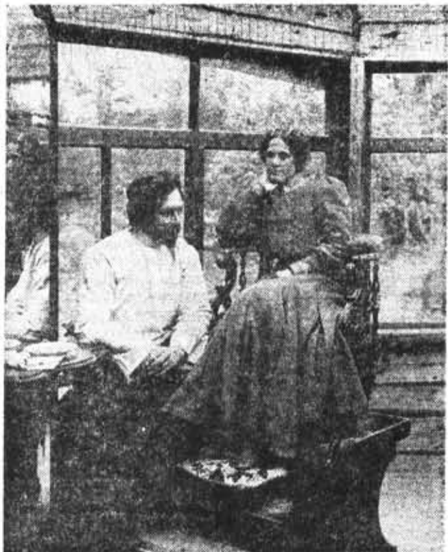
Из собрания Центрального государственного архива кинофотофонодокументов Ленинграда. Редкий снимок дореволюционной поры. Известный русский писатель Леонид Андреев с женой в репинских Пенатах.