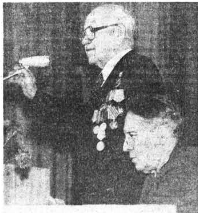
Фоторепортаж Т. Гусевой с вечера ленинградцев-блокадников.

В. МОТОВ , член бюро совета ветеранов блокады