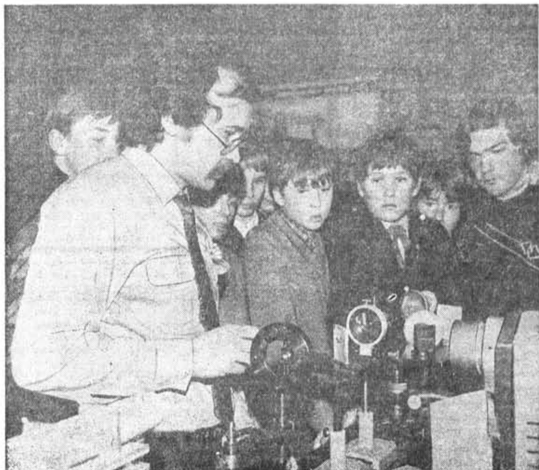
Ученики подшефной школы в лаборатории кафедры СОФП.