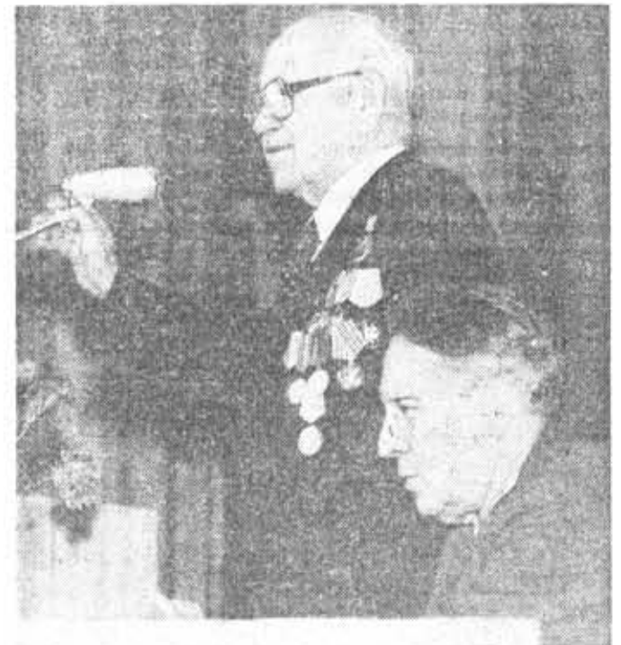
с вечера ленинградцев-блокадников.

В. МОТОВ , член бюро совета ветеранов блокады