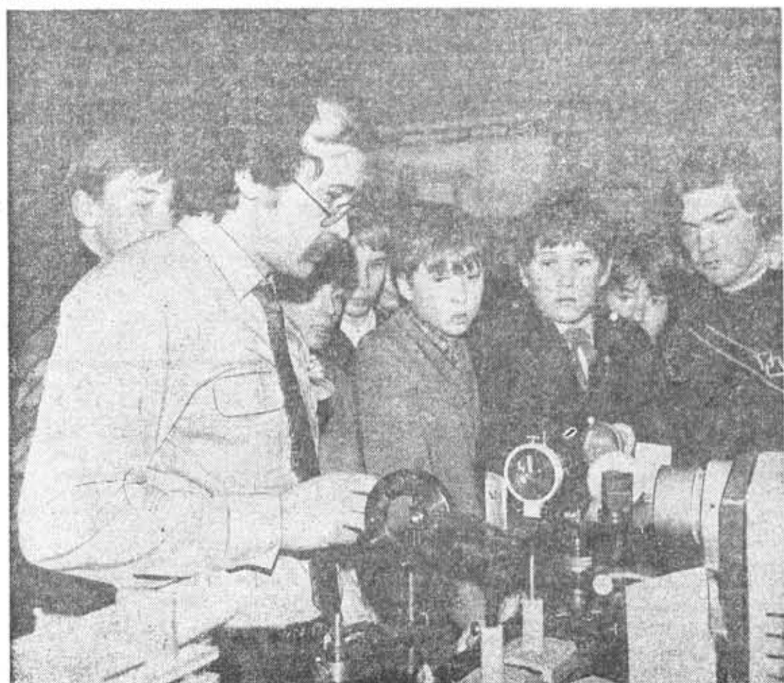
Ученики подшефной школы в лаборатории кафедры СОФП.