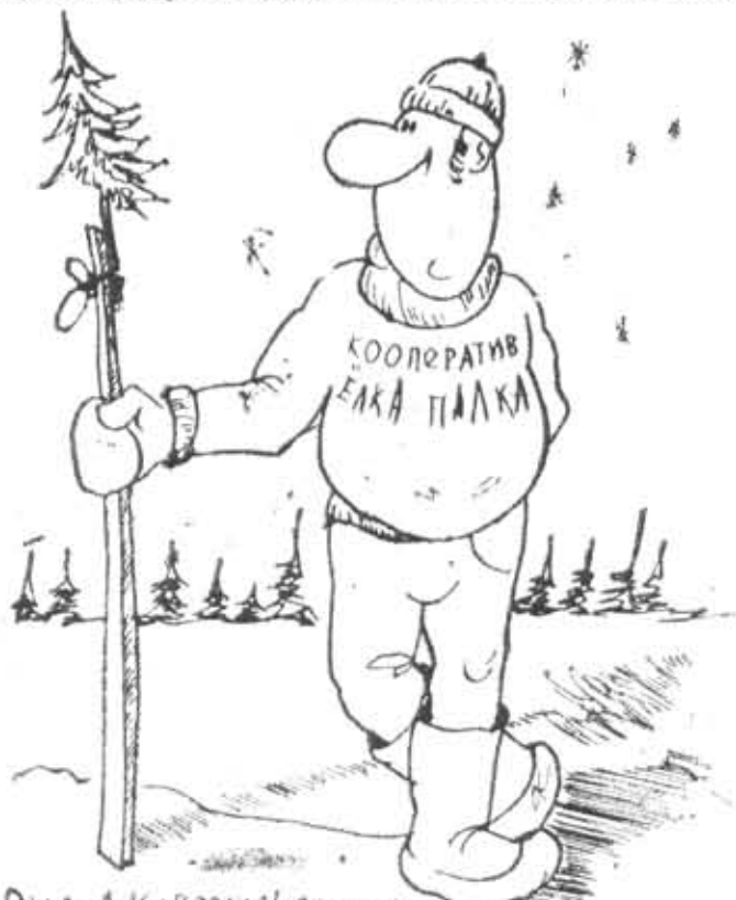
Рис. А. Козержевского