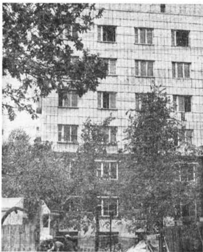
Заканчивается строительство нового корпуса студенческого общежития ЛИТМО на Вяземском.

НЕУЗНАВАЕМО ИЗМЕНИЛИСЬ за последние годы сельские районы Ленинградской области. Здесь создается огромный агро-промышленный комплекс.