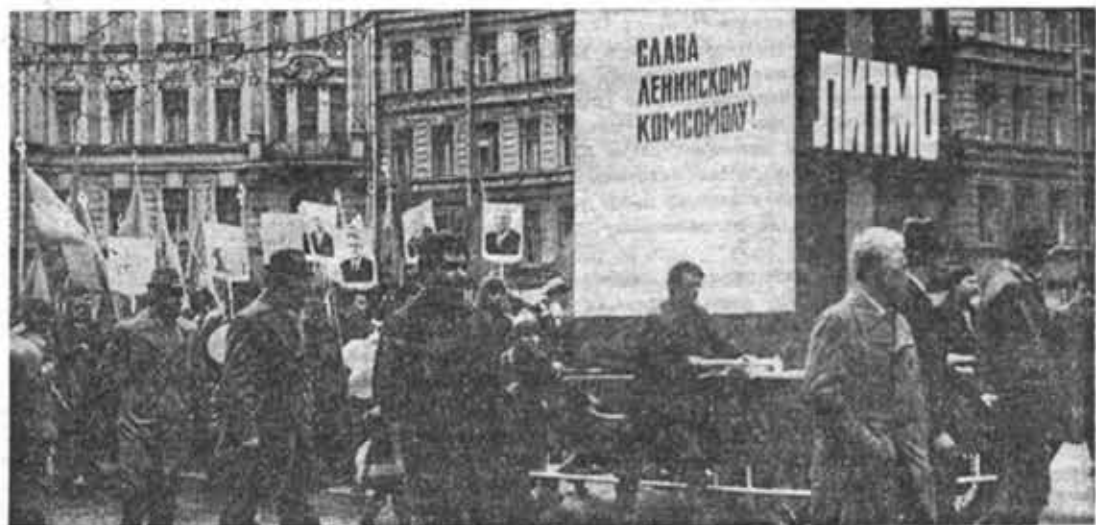
Колонна Ленинградского ордена Трудового Красного Знамени института точной механики и оптики на Первомайской демонстрации.