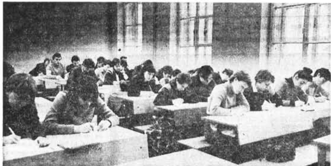
Важнейшее значение для формирования мировоззрения студентов имеет изучение ими дисциплин социально-политического цикла. На снимке: пятикурсники оптического факультета на лекции по научному коммунизму.