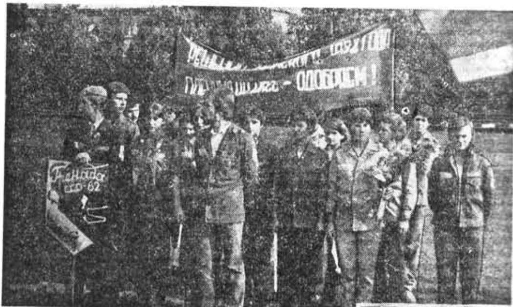
Проверенная временем форма трудового воспитания молодежи — студенческий стройотряд.