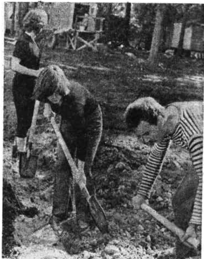
Приближается ответственная пора трудового семестра, завершается формирование ССО, отряды проводят субботники и воскресники.

Л. ЛАГВИЛАВА, доцент кафедры политэкономии