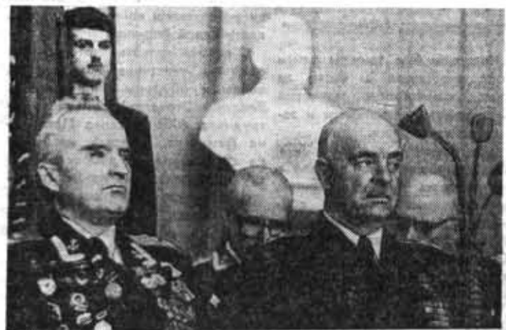
В президиуме институтского военно-патриотического вечера

С болью перебираю я сегодня судьбы своих друзей по школе, сверстниц и тех, кто был постарше. Почти все они лишились в эти страшные годы своих женихов, молодых мужей... Сколько выплачено слез, сколько было бессонных ночей... А когда война закончилась, то еще долгие годы мы ощущали ее беспощадную жестокость. Со всех сторон окружали нас инвалиды, сироты, вдо-