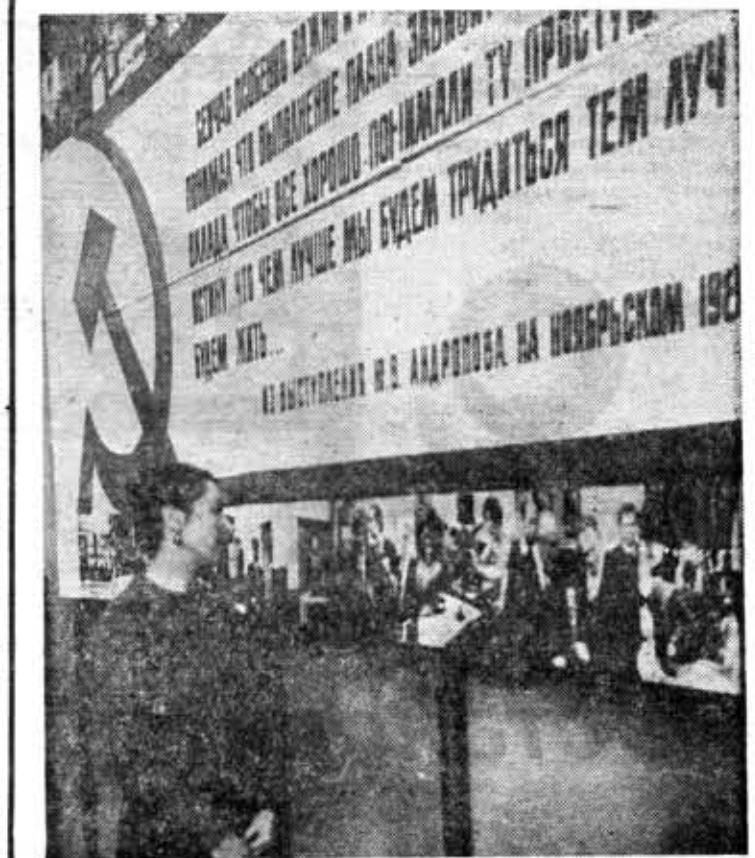
Важные решения последних партийных форумов, указания Генерального секретаря ЦК КПСС, Председателя Президиума Верховного Совета СССР товарища Ю. В. Андропова находят отражение на стендах, панно и в других формах наглядной агитации, обновлению которых в институте уделяется постоянное внимание.

ПРЕДСТАВЛЯЕТСЯ, что основным центром, координирующим усилия по уменьшению потерь учебного времени, должен быть деканат. Любое освобождение студентов от учебных занятий должно проводиться только в исключительном случае при наличии личного заявления, ходатай-