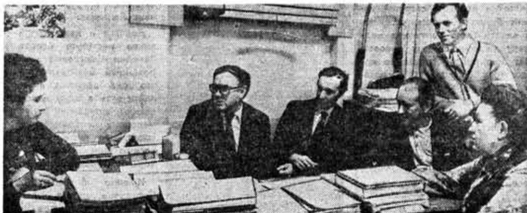
Заседание совета кураторов вечернего факультета вычислительной техники и автоматики.