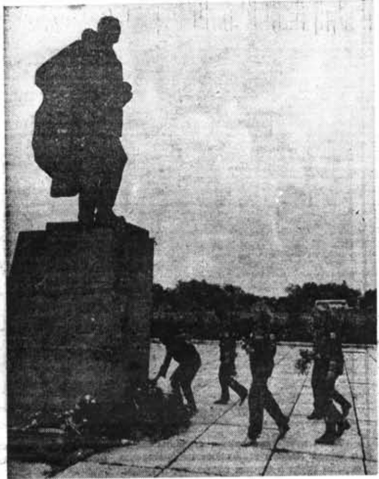
Студенты института чтут память героев, погибших на фронтах Великой Отечественной войны. Цветы к монументу возлагают бойцы студенческого строительного отряда «Одиссей».

ВСЕСОЮЗНАЯ полковая экспедиция «Летопись Великой Отечественной» — составная часть Всесоюзного похода комсомольцев и молодежи по местам революционной, боевой и трудовой славы советского народа.