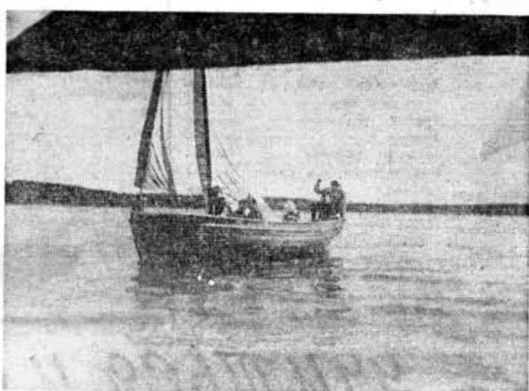
НА СНИМКАХ: ЭПИЗОДЫ ЛЕТНЕГО АГИТАЦИОННОГО ШЛЮПОЧНОГО ПОХОДА ЛИТМОНАВТОВ ПО ВУОКСЕ.