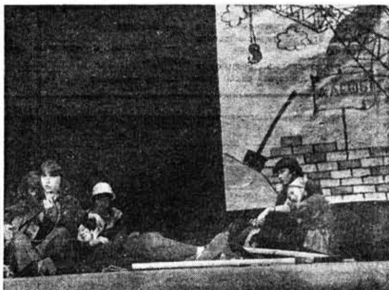
Из фотолетописки ССО. Выступает агитколлектив отряда «Гренада».