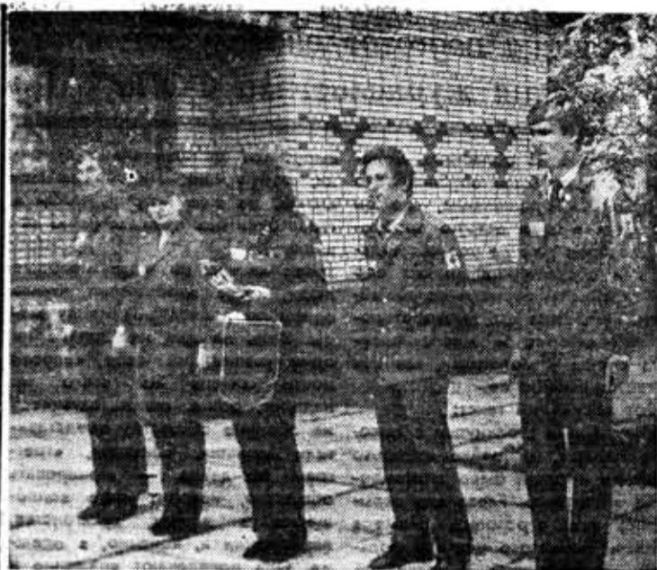
Из фотолетописки ССО. На торжественной линейке, посвященной открытию лагеря ССО «Оптика».

Уже к началу апреля отряды были укомплектованы примерно на 80 процентов. Некоторое отставание на этом этапе имелось на инженерно-физическом факультете.