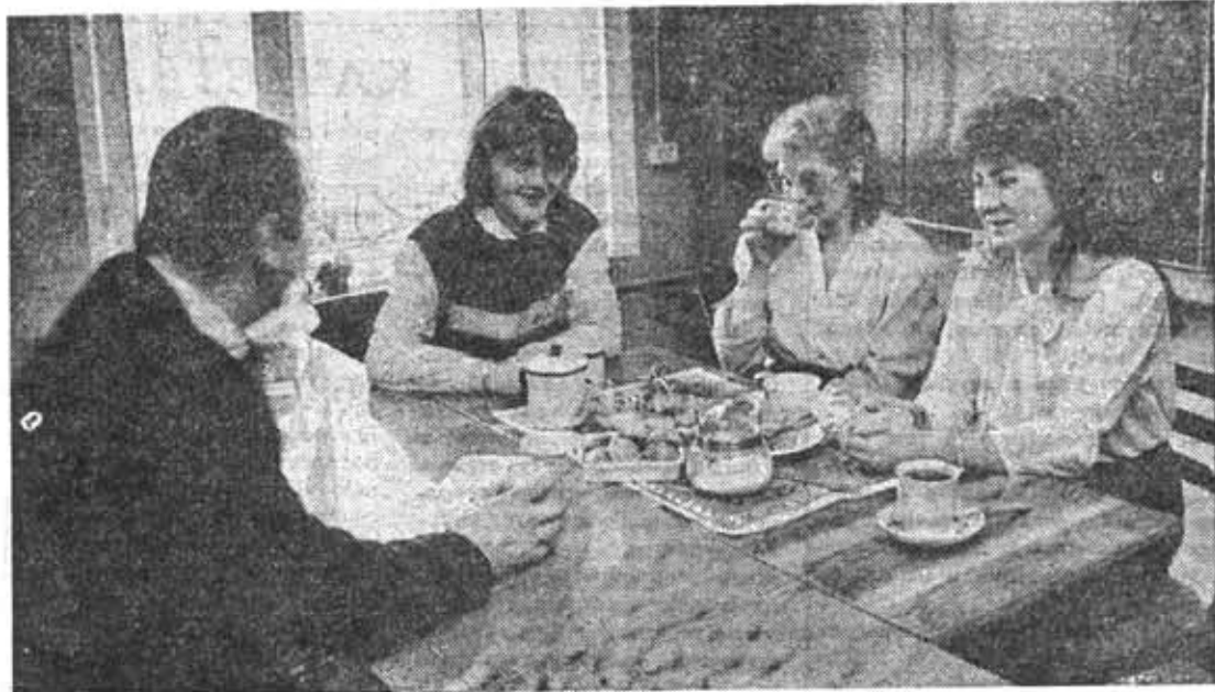
Пока нет столовой,

Завершился первый семестр. Несмотря на бытовые, дорожные и другие объективные трудности учебная программа была выполнена. И это главное.