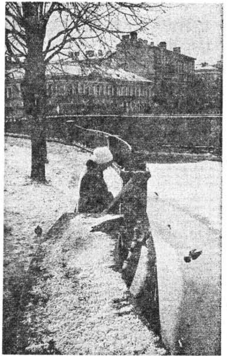
Наш город.