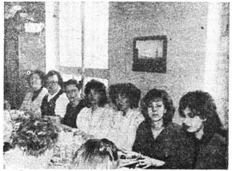
Дружны во всем.