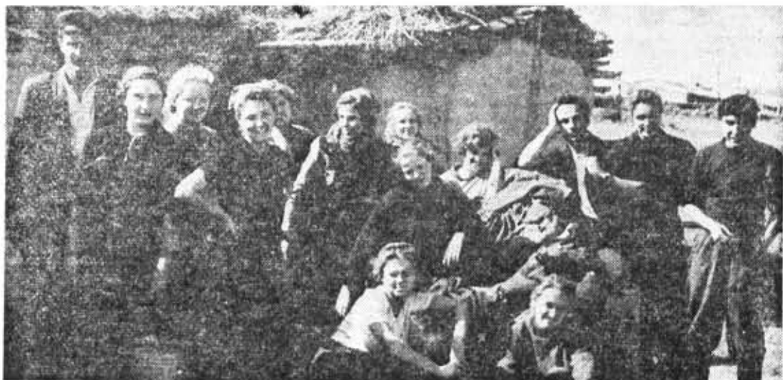
Целинное лето 1957 года. «Оптички-физички», С. Родионова

Были и трудности. Ночи стояли темные-претемные. В просторах их зеленых земель водились волки и другие хищники. Экзотичной все это стало восприниматься лишь теперь. А в ту пору приходилось нелегко, особенно в бытовых вопросах. Но все перекрывало радость общения в труде и сознание значимости всего происходящего. Возможностей проверить, кто есть кто, было немало. Помню, как пришлось нам ту-