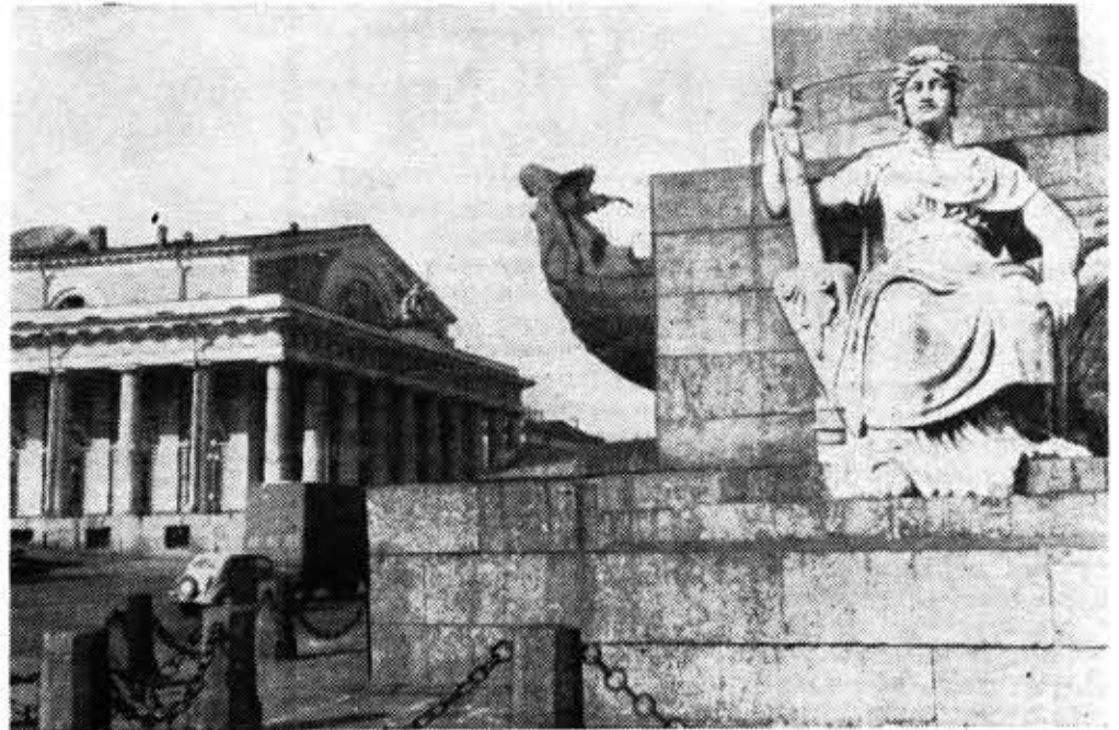
Фотоэтиюд студента Льва Мусина «Июнь».

ЛУЧШИЕ фильмы, созданные на киностудиях страны за последние два года, будут вскоре демонстрироваться на первом Всесоюзном кинофестивале, который откроется в нашем городе в июле. Любители кино смогут ознакомиться с лучшими работами, выполненными в самых разнообразных кинематографических жанрах и, конечно, самый большой интерес вызовут художест-