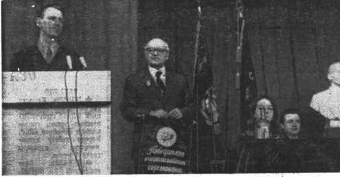
Слет отличников учебы ЛИТМО. Ректор института профессор С. П. Митрофанов награждает победителей социалистического соревнования.