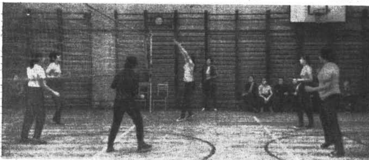
ВТРОКУРСНИЦЫ ФОЭП НА ЗАНЯТИЯХ ИНСТИТУТСКОЙ ВОЛЕЙБОЛЬНОЙ СЕКЦИИ.

Особенно удачно выступали наши юноши-первокурсники. Чемпионом на стометровке стал студент 160-й группы Б. Шишулин, в толкании ядра первенствовал В. Брабич (150-я группа), первое место в состязаниях по тройному прыжку занял В. Антонен (156-я группа).