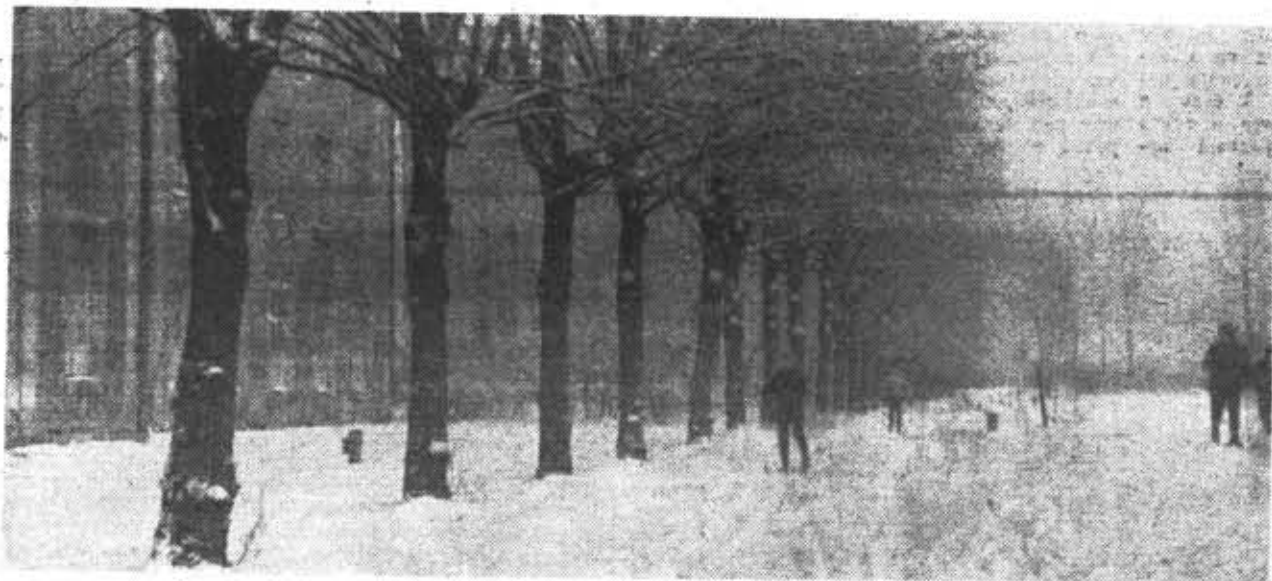
НА ТРАССЕ ЛЫЖНЫХ СОРЕВНОВАНИЙ ПО СДАЧЕ НОРМ ГТО.

Е. РЫБАЧУК, заместитель председателя ячейки РОКК