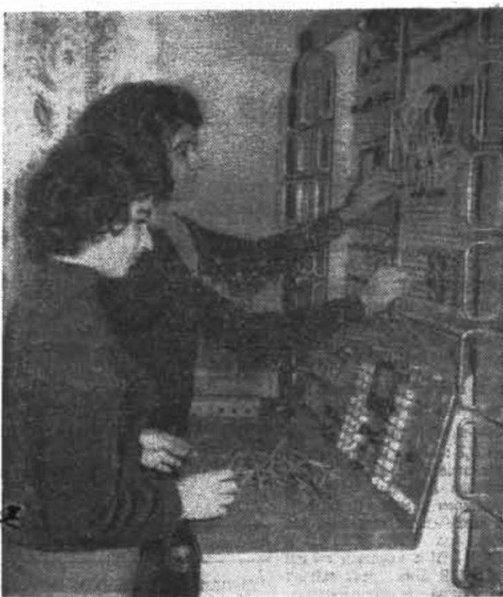
Старшекурсники ФТМВТ широко привлекаются к исследовательским работам на кафедре вычислительной техники. На снимке: работа на АВМ.

Работа профгоров слабо контролируется, крайне редко бывает чтобы в группе переизбрали профорга, не справившегося со