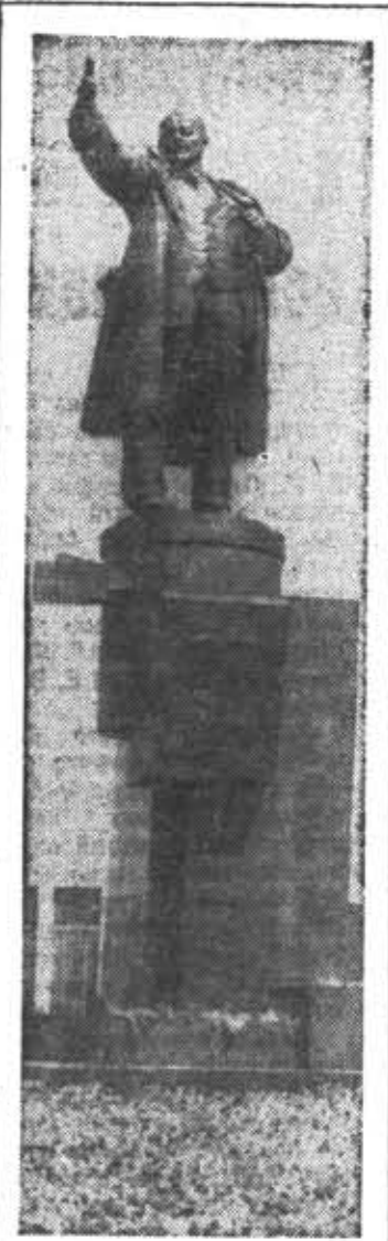
Памятник В. И. Ленину у Финляндского вокзала.