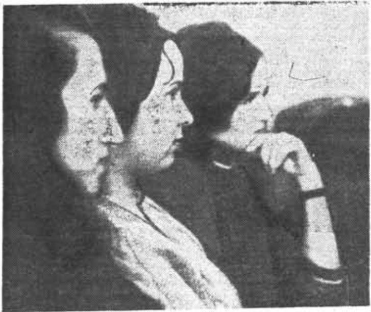
На вечере оптиков.