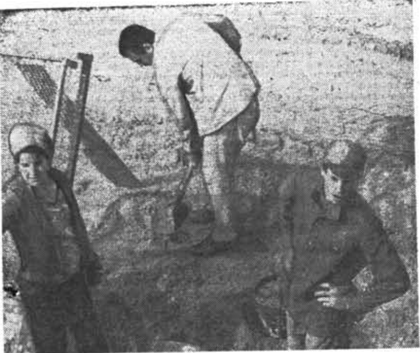
Одним из направлений участия студентов в общественно полезных делах является третий трудовой семестр. На летних стройках студенческие отряды работают бок о бок с рабочими коллективами. На снимке: бойцы отряда «Товарищ» на стройке в Ставропольском крае.