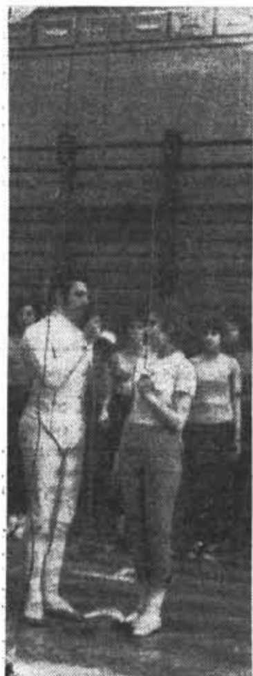
На снимках: торжественное открытие соревнований — подъем флага; один из боевых эпизодов.

В ОТ НА ШЕСТИ ПО- Ляхх начались упорные поединки. 429 спортивных дуэлей — 3013 точных уколов и ударов. 103 участника личного первенства на рапирах, саблях и шпагах представляли шесть команд факультетов. Подавляющее большинство, конечно, составили представители младших курсов. Но это уже были не робкие новички. За плечами у большинства — два года подготовки.