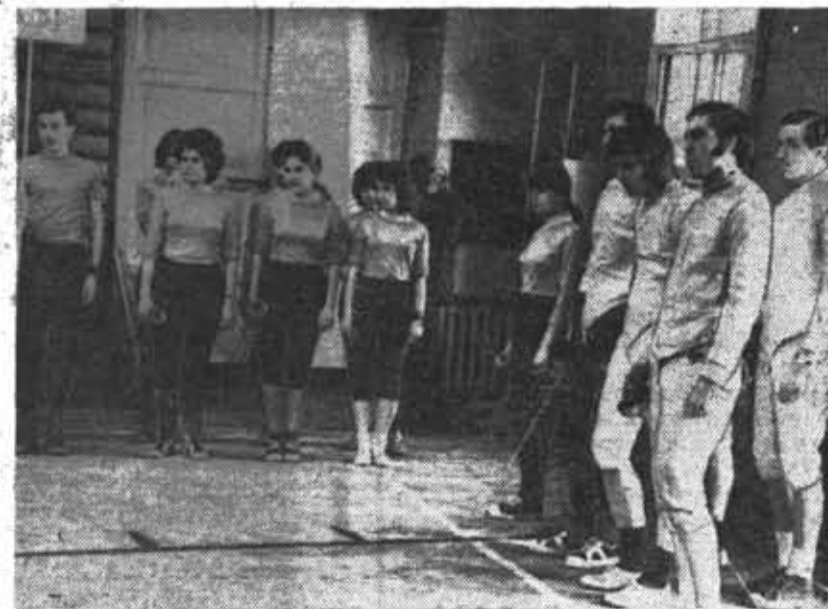
Секция фехтования — одна из наиболее успешно выступающих на городских соревнованиях секций спортклуба. Массовый характер носило первенство ЛИТМО по фехтованию. Победу одержала команда младшекурсников факультета точной механики и вычислительной техники. На снимке: фехтовальщики ФТМВТ.