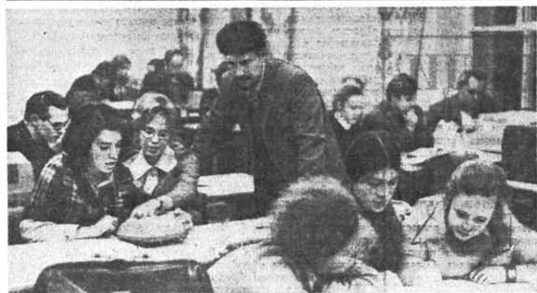
Учебные занятия на кафедре экономики промышленности и организации производства.