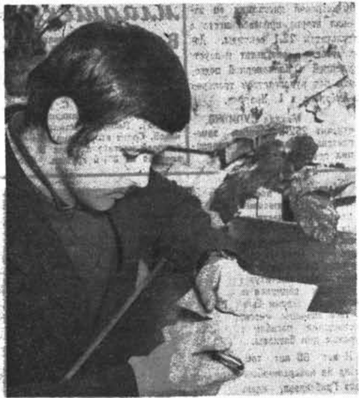
проектируемого устройства и отклоняться от принятых решений по ним более лучших. И так до студентов общежития обсуждалась справедливость такого утверждения для конструирования и

го образца устройства вызывают исключительно положительные эмоции. А вот стирание неверных решений и ношение чертежей в институт и обратно, как правило, связано с появлением отрицательных эмоций.