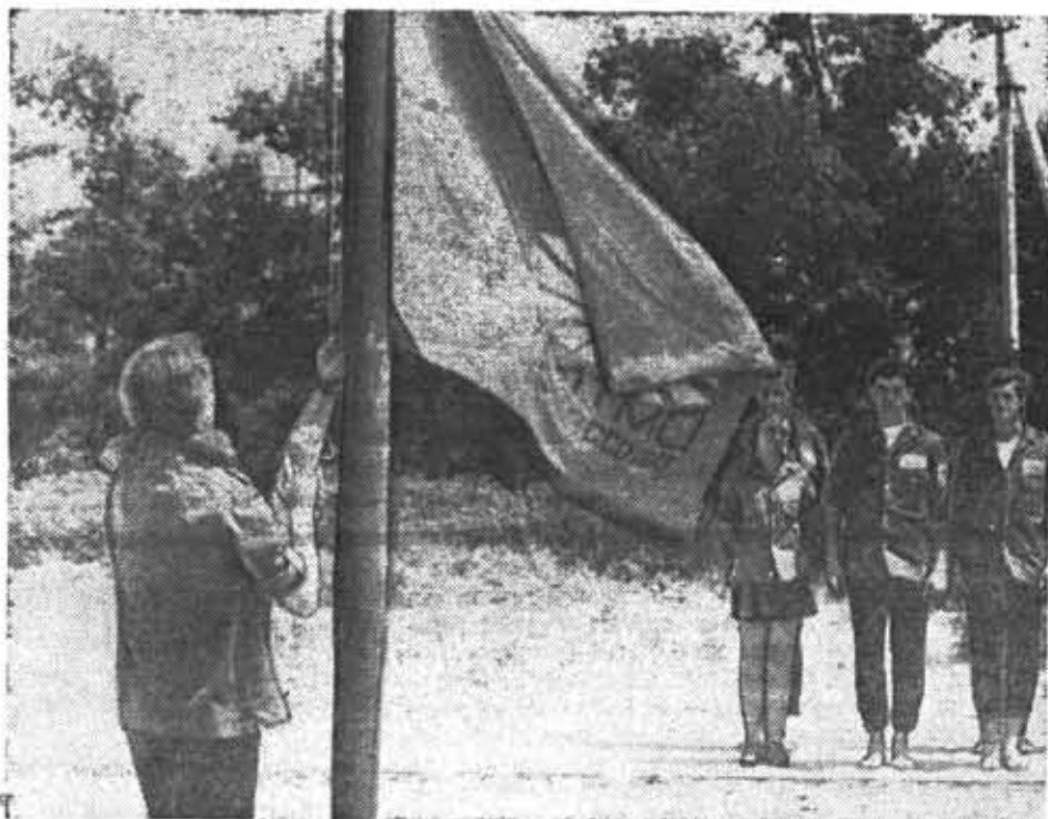
КРЕПКАЯ ДРУЖБА СВЯЗАЛА БОЙЦОВ ИНТЕРНАЦИОНАЛЬНОГО ССО «ТОВАРИЩ», ВЫЕЗЖАВШЕГО ПРОШЛЫМ ЛЕТОМ В СТАВРОПОЛЬСКИЙ КРАЙ.

ЗНАЧИТЕЛЬНЫЙ подъем молодежного движения протеста в странах капитализма, наметившийся в начале 60-х годов и достигший своего апогея в 1968 году, вызвал пристальное внимание во всем мире. Этот естественный интерес к проблемам молодежи был немедленно использован буржуазной пропагандой. Огненно-рыжий студент из Сорбонны Даниэль Кои-Бендин, призывавший «бить парней из коммунистической партии», или яростный главарь леваков в ФРГ Руди Дучке стали суперзвездами рекламного небосвода, а пресловутая книга «друга молодежи» Герберта Маркузе «Одномерный человек», противопоставляющая капиталистическую стереотипизацию человеческого сознания штампы псевдореволюции без рабочего класса, стала бестселлером.