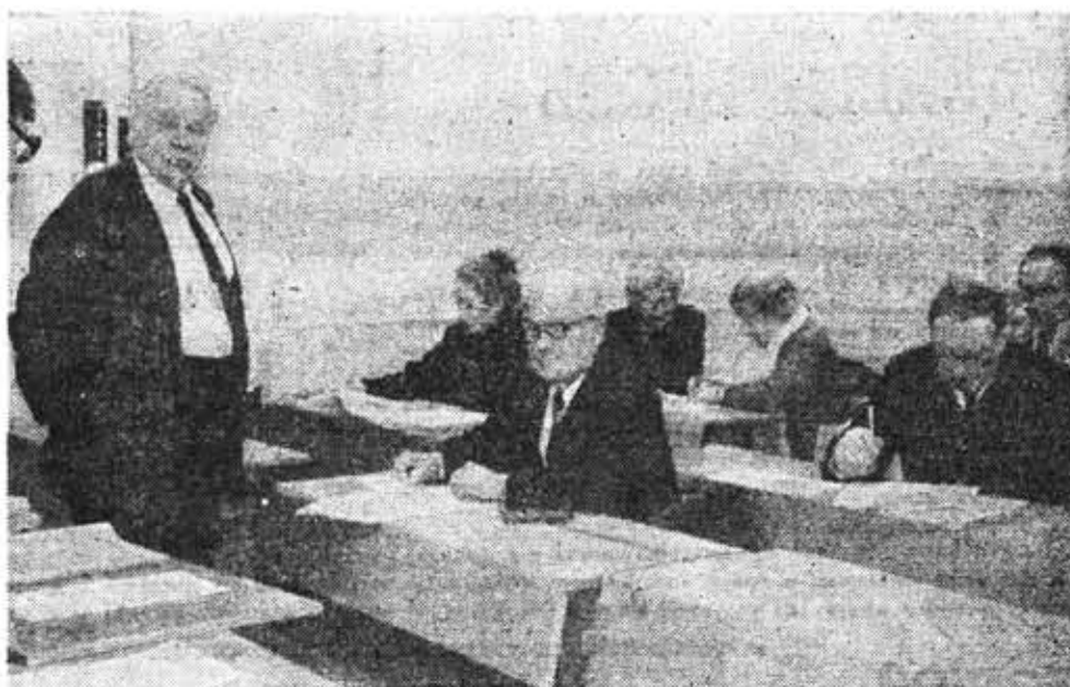
На собрании блокадников.