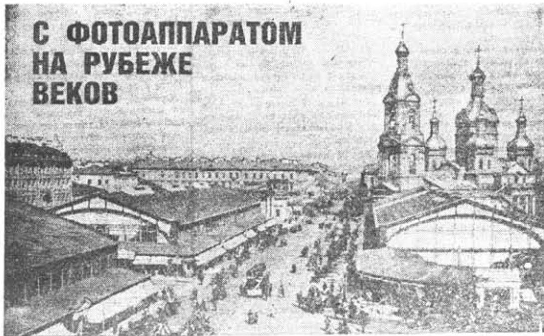
Сенная площадь в начале XX века