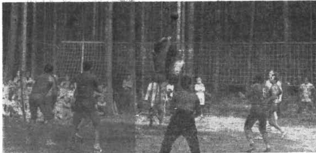
Волейбольный турнир в спортлагере ЛИТМО.