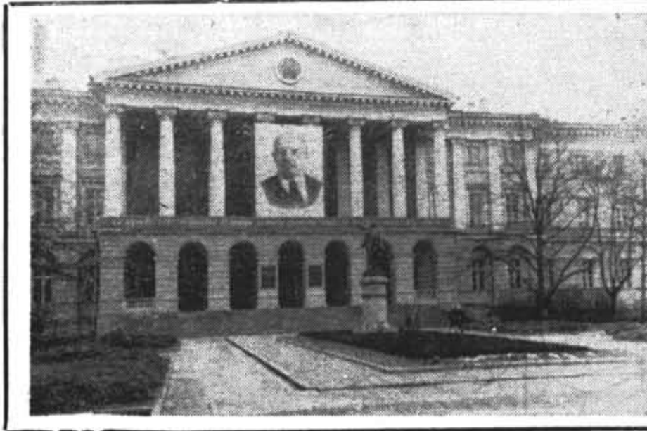
СМОЛЬНЫЙ — ШТАБ ОКТЯБРЯ. ОТНОВА В ГРОЗОВОМ СЕМНАДЦАТОМ ОТПРАВЛЯЮТСЯ ОТРЯДЫ КРАСНОГВАРДЕЙЦЕВ НА ПОСЛЕДНИЙ ШТУРМ СТАРОГО МИРА.

СОВЕТСКИЕ УЧЕНЫЕ И ИНЖЕНЕРНО-ТЕХНИЧЕСКИЕ РАБОТНИКИ! РАЦИОНАЛИЗАТОРЫ И ИЗОБРЕТАТЕЛИ! ВСЕМЕРНО УСКОРЯЙТЕ НАУЧНО-ТЕХНИЧЕСКИЙ ПРОГРЕСС ВО ВСЕХ ОТРАСЛЯХ НАРОДНОГО ХОЗЯЙСТВА, ПОВЫШАЙТЕ УРОВЕНЬ НАУЧНЫХ И КОНСТРУКТОРСКИХ РАБОТ! ДОБИВАЙТЕСЬ БЫСТРЕЙШЕГО ВНЕДРЕНИЯ В ПРОИЗВОДСТВО ДОСТИЖЕНИЙ НАУКИ, ТЕХНИКИ И ПЕРЕДОВОГО ОПЫТА!