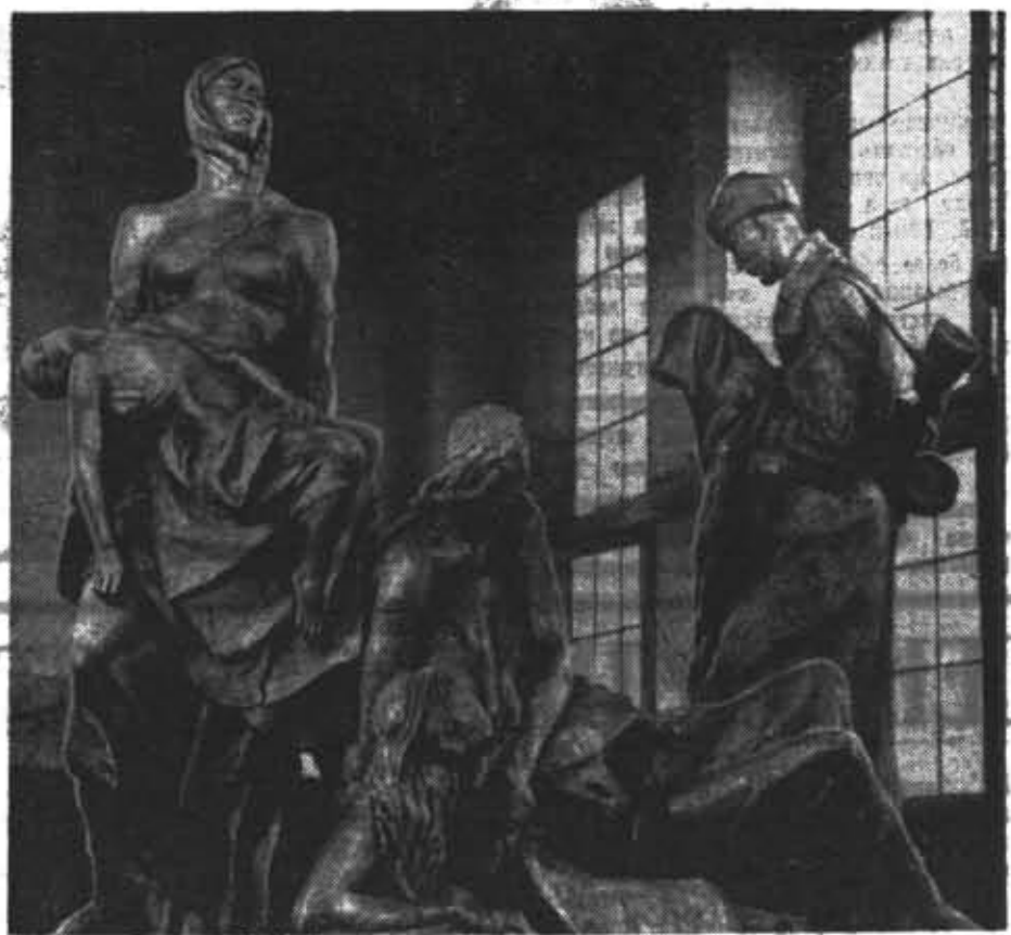
На заводе «Монументальскульптура» отлиты в бронзе первые скульптурные фрагменты «Блокада» и «Литейщики» — из композиции многофигурного памятника защитникам Ленинграда в годы Великой Отечественной войны.

Тысячи ленинградцев уже приняли участие в работах по сооружению памятника героическим защитникам невиской твердыни. В трудовой эстафете, начатой по призыву коллектива объединения «Электросила» имени С. М. Кирова представителями Московской заставы, уже приняли участие трудящиеся Кировского, Выборгского, Калининского, Невского и других районов. В едином трудовом строю вместе с жителями Ленинграда в работах на площади Победы с первых дней строительства мемориала участвуют многочисленные гости города. «География» такого личного участия простерлась от западных границ страны до Шикотана — одного из курильских «самых дальних наших островов». «Хотим, чтобы памятник, построенный руками тысяч ленинградцев и гостей города, стал символом братства и дружбы!» Такую запись в альбоме, учрежденном штабом содействия строительству, оставили, поработав на площади Победы, молодые чехи и словаки. В Ленинград студенты Высшей школы железнодорожного транспорта в городе Жилина (ЧССР) приезжали в составе интернационального студенческого строительного отряда.