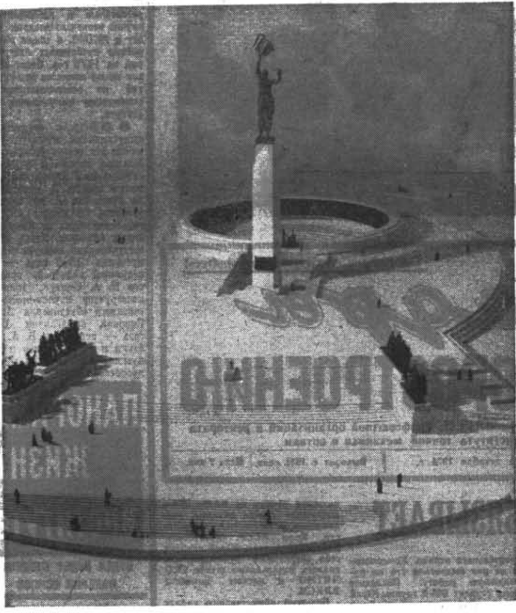
Общий вид памятника, который будет установлен на площади Победы в Ленинграде.