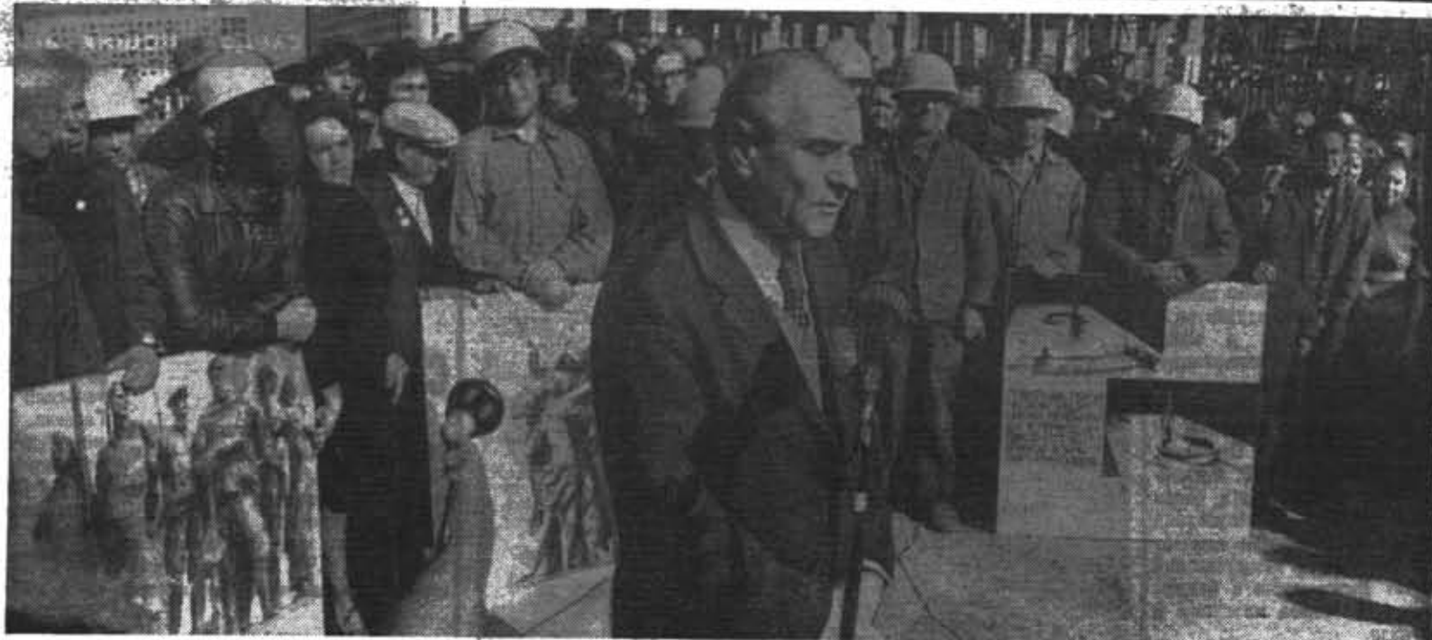
Один из авторов проекта народный художник СССР, лауреат Ленинской премии М. К. Аникушин среди строителей памятника.

Так сейчас выглядит панорама стройки, к которой стал причастен каждый ленинградец. Как и в период создания Зеленого пояса Славы, жители города считают долгом своей совести принять личное участие в возведении памятника, которому предстоит стать «вечным символом